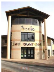
Ecole des Sources

Ecole publique des Sources Route d'Ancy 69210 Savigny tel : 04 74 01 13 51 Mél : ce.0691446x@ac-lyon.fr http://www2.ac-lyon.fr/etab/ecoles/rhone/des-sources/