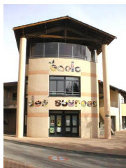
Ecole des Sources

Ecole publique des Sources Route d'Ancy 69210 Savigny tel : 04 74 01 13 51 Mél : ce.0691446x@ac-lyon.fr http://www2.ac-lyon.fr/etab/ecoles/rhone/des-sources/